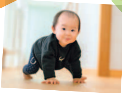
いちかちゃん こぐま歩き上手でしょ