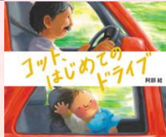
コット、はじめてのドライブ 阿部結/作・絵