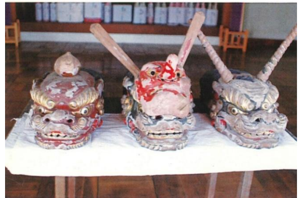
小久喜の獅子舞 隠居獅子頭

小久喜のささら獅子舞は、舞方だけでなく、獅子舞を大切に思う地域の人々の心が一つになって守られてきた歴史文化だといえます。時代とともに、薄れてきている部分はありますが、これからも地域の伝統文化を地域の手で守り続ける模範として末長く大切にすべきものだといえます。