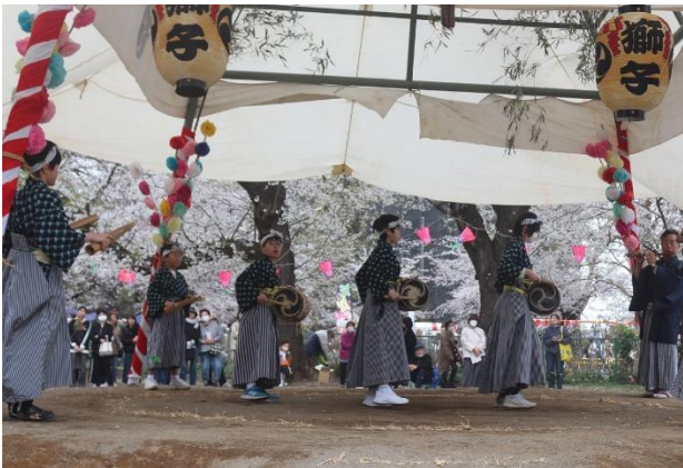
南小学校郷土研究クラブの奉納

昭和 61 年から始まった地元の南小学校郷土研究クラブの子供たちによる獅子舞の継承活動が令和になった現在でも続けられており、地域に根差した伝統芸能として長く継承されています。