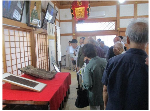
野牛地区文化財一般公開の様子