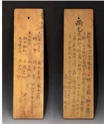
雨乞い感謝の木札

獅子舞は大獅子、中獅子、女獅子の3頭の獅子と笛吹き、ささら摺り、天狗、歌方などで構成され、悪霊退散や雨乞い、五穀豊穡など民衆の素朴な祈願を込めて奉納されてきました。