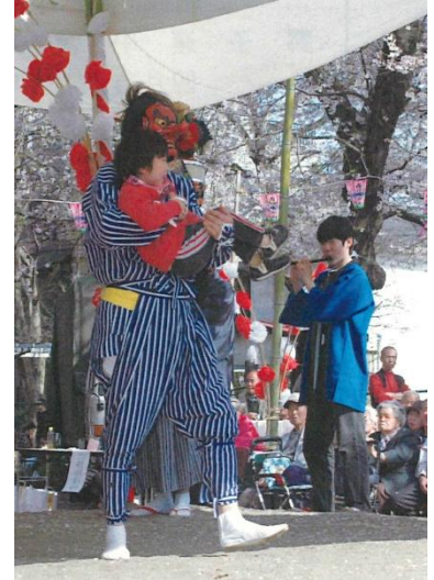
道化役としての天狗

一方、獅子舞を見る側にも様々な祈りや願いがあり、獅子連中への差し入れや賄いをしたり、家族はもちろん親戚にも声を掛け御馳走を作って振る舞ったりして喜び感謝する気風が育まれてきました。