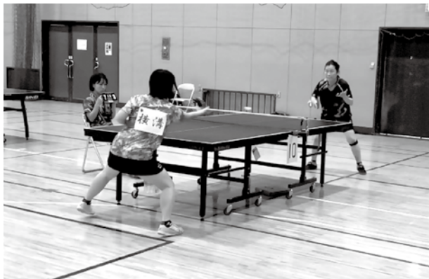
市民大会女子決勝（表紙は同 男子決勝）