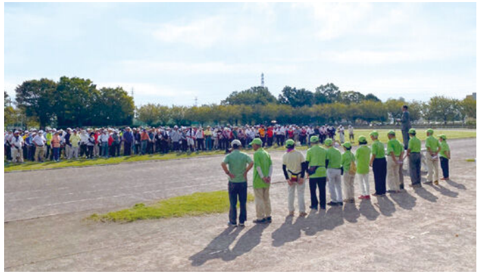
9月20日(水) 第1回白岡市長杯グラウンド・ゴルフ大会 開会式

グラウンド・ゴルフは、中高年を中心に大変人気のあるスポーツで、いつでも、どこでも、誰でも、手軽に楽しめるスポーツです。