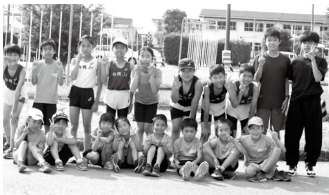
6月25日 ファインカップ

気がつきました。練習は、楽しいトレーニングもありますが、時には厳しい事もありました。挫折そうになりましたが、負けられないという気持ちも強くなり、仲間と一緒に最後まで取り組みました。練習の成果もあり、小学校最後の持久走大会で、満足のいく走りができました。