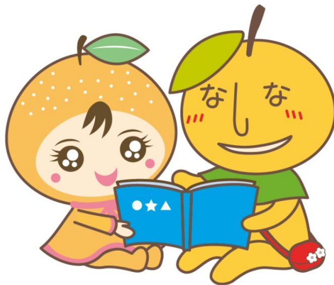
白岡町キャラクター なしりん・なしべえ

白岡町では、このたび、協働事業の提案を募集します。 町内で地域活動を行う団体や市民団体などが、協働事業を自ら 企画・提案・実施するものに対し補助金を交付します。 まちづくりに一緒に取り組みませんか。