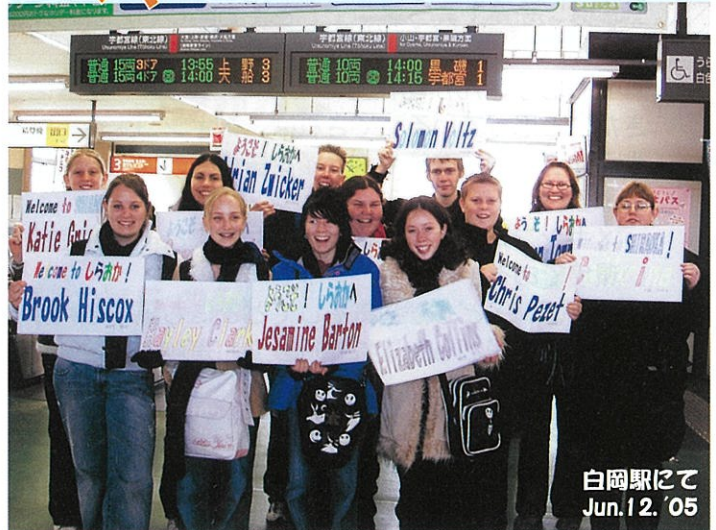
白岡駅にて Jun.12. '05