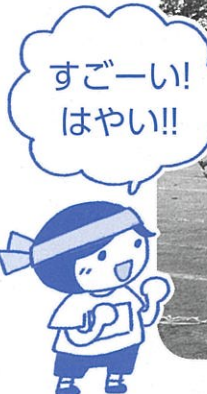
どんどん積み込めー!!