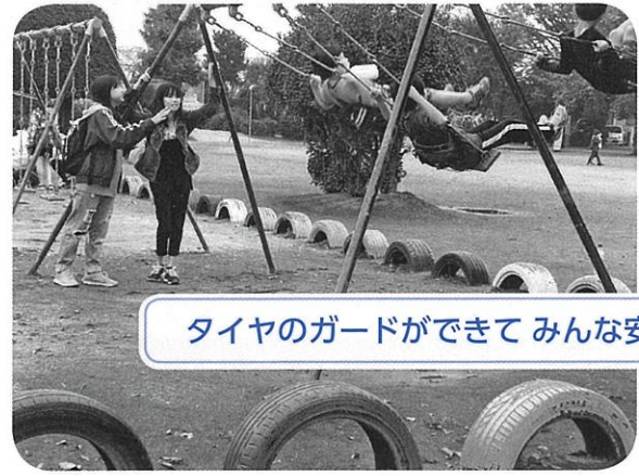
タイヤのガードができてみんな安心