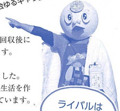
ライバルはシラオ仮面…

資源回収・運動会・バザーの手伝いや参加のほか、資源回収後にイベント（図工教室やカレーパーティーなど）を行っています。 現在は1年間に6回活動しています。 子どもたちと触れ合う機会やお父さん同士の交流も増えました。 堅苦しい会ではないのでぜひ参加して、子どもたちの学校生活を助ける手助けを！西小保護者であれば、どなたでも参加お待ちしております。