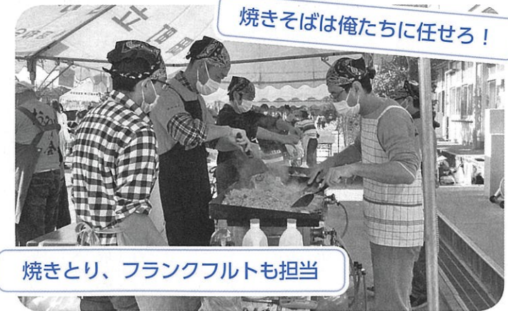
焼きとり、フランクフルトも担当