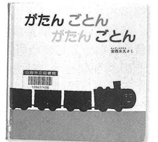
がたんごとん がたんごとん あんざいみずる (安西水丸著・福音館書店)

他には、擬音、オノマトペの絵本『がちゃがちゃどんどん』『がたん ごとん がたん ごとん』や、ゲーム感覚の絵本『ミック』など。また、『おおきなかぶ』などの、むかし話や民話も物語りとして読み聞かせやすいです。