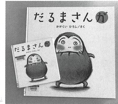
だるまんが かがくいひろし著・ブロンズ新社