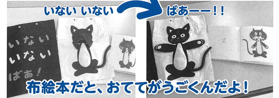
いないいないばあ まつたに せがわやすお (松谷みよ子著・瀬川康男絵・童心社)

普段読みなれた絵本でも、大型絵本や布絵本など、図書館ではいろいろな絵本が貸し出されています。大型絵本は大迫力で子どもも大喜び!