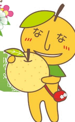
白岡市マスコットキャラクター なしべえ