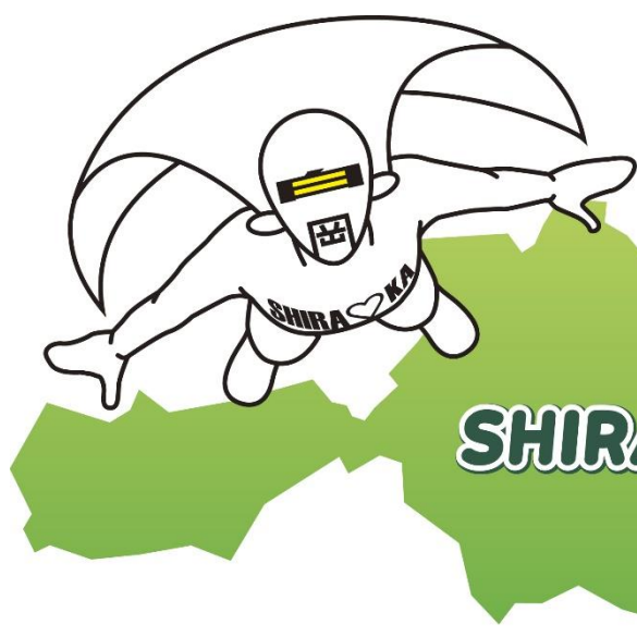
白岡市マスコットキャラクター シラオ仮面