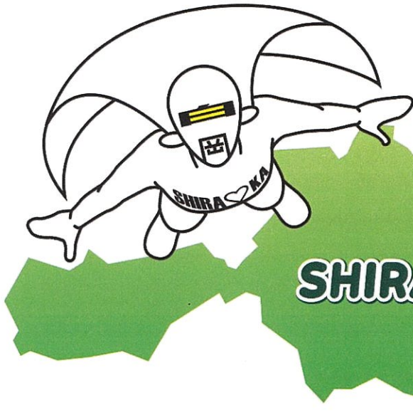
白岡市マスコットキャラクター シラオ仮面