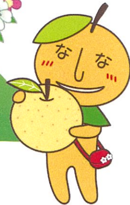
白岡市マスコットキャラクター なしべえ